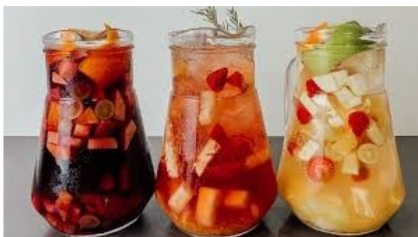
IMAGEM SOMENTE ILUSTRATIVA